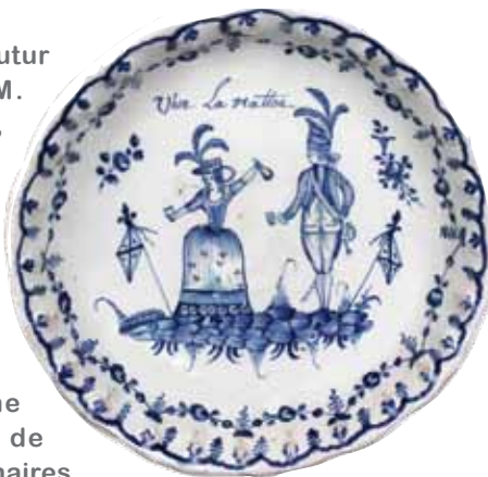
Plat, décor à l'élegante et au garde national. Aire-sur-la-Lys, vers 1789-1791